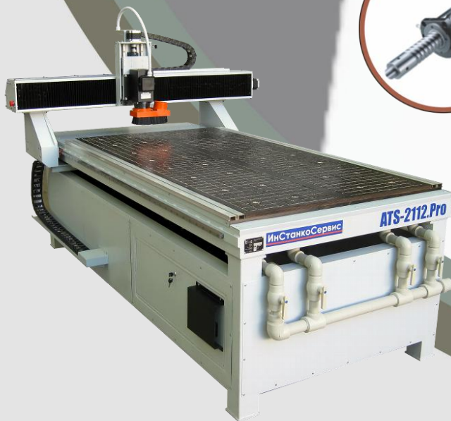
На фото станок «ATS-2112.Pro» с вакуумным столом